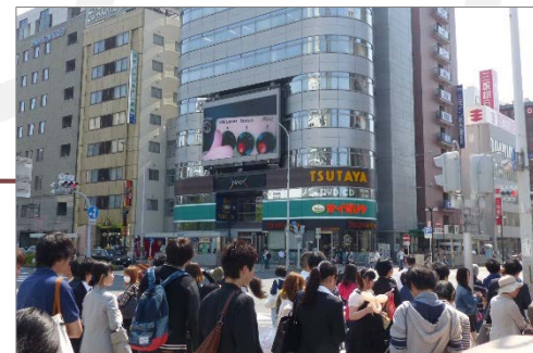
目の前の広場には昼夜問わずたくさんの方が行き交います