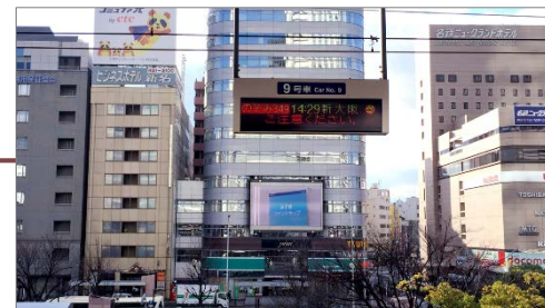
新幹線ホームも視聴エリアです