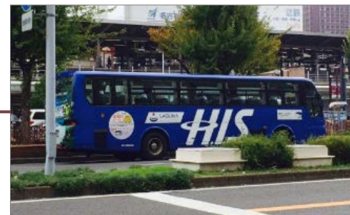
様々な大型バスの乗降車所となっています