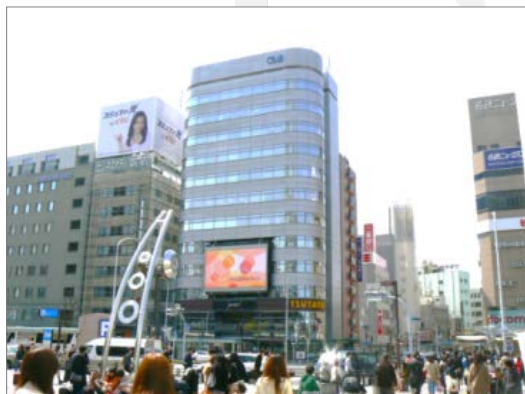
朝6時～深夜24時まで放送を行っています