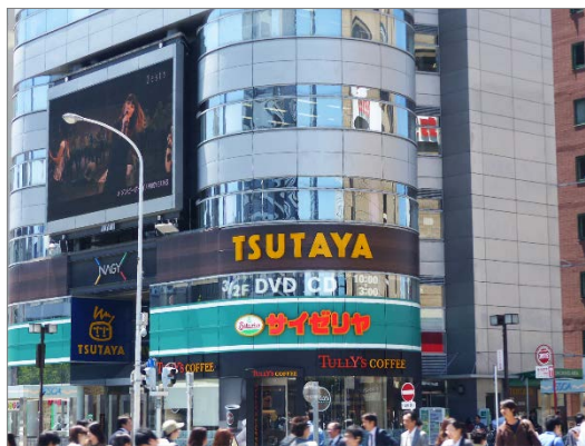
幅広い客層が集まるTSUTAYA・カフェ・レストラン